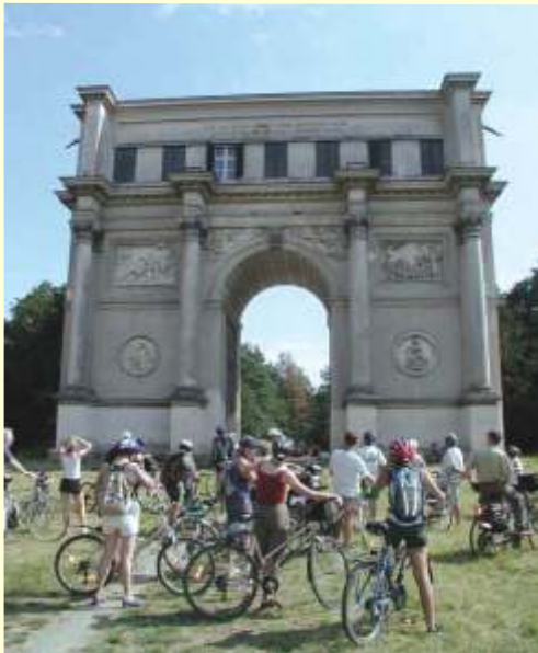
Lednice - Rendezvous (Dianatempel)