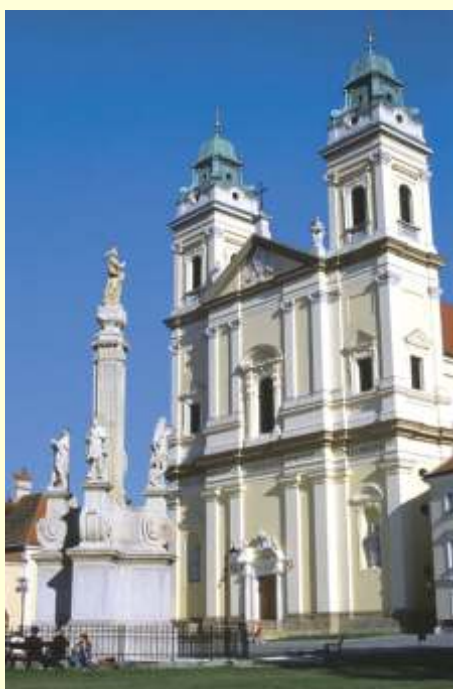
Feldsberg- Kirche, www.breclav.info

Die Route führt über Feldwege, zum Teil asphaltiert, auf CZ-Seite über ehemalige Militärstrassen die zwar asphaltiert aber zum Teil in schlechtem Zustand sind (Schlaglöcher!) und über wenig befahrene Landstrassen. Sie weist eine größere Steigung zwischen Schrattenberg und dem Grenzübergang auf (ca 1.8 km). Die Tour kann mit jedem Radtyp, außer Rennrädern, befahren werden.