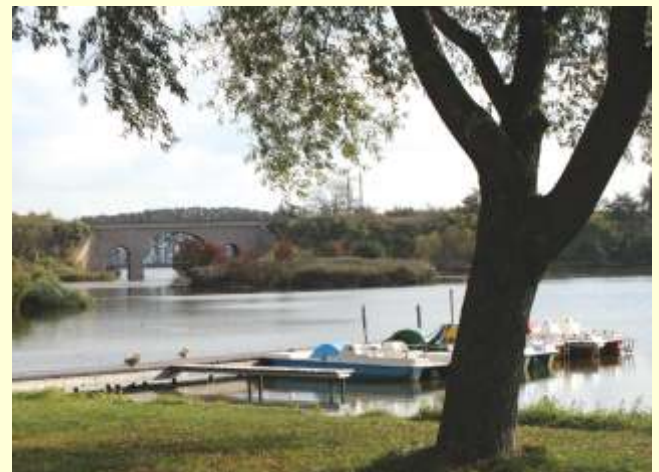
Bernhardsthal - am Teich, im Hintergrund das Bahnviadukt

Säulengang Reistna (Kolonáda Reistna); Aussichtspunkt am Hügel Homole; Schloss Feldsberg (Zámek Valtice), Tel. 00420/519/352423; Schlosskeller („Zámecký sklep“), Tel. 00420/519/352329, Historischer Weinkeller, Tel. 00420/519/352402; Dianatempel (Rendezvous); Jagdschlösschen in der Form eines Triumphbogens; Hubertkapelle (Svaty Hubert), dem Patron der Jäger geweihte Kapelle; Drei Grazien Tempel (Tri Grácie); Kolonnade mit Statuengruppe antiker Göttinnen; Neuhof (Novy dvůr), Pferdehof mit rundem Grundriss; Apollo Tempel (Apollonuv chrám); Pavillion mit Aussichtsterrasse; Janohrad (Janův hrad), künstliche Burgruine; Jagdschlösschen (Lovecký zámeček); Minarett, 62 m hoher Aussichtsturm im maurischen Stil; Schloss Eisgrub (Zámek Lednice), Tel. 00420/519/340128; Teichschlösschen (Rybníční zámeček); Grenzschlösschen (Hranicní zámeček);