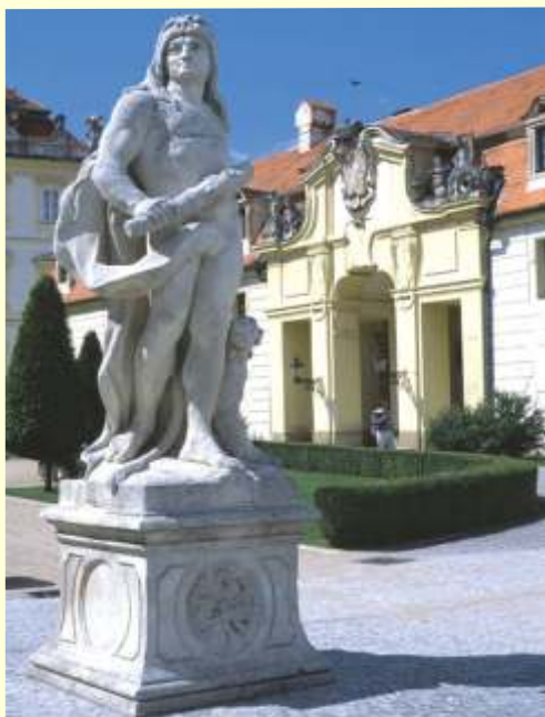
Valtice - Schloss Valtice (Feldsberg)