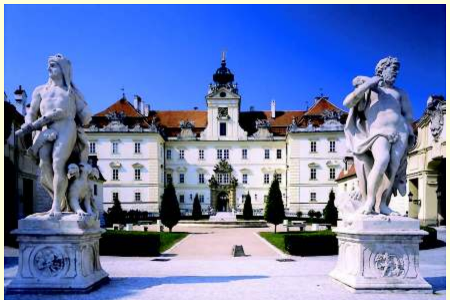
Schloss Feldsberg (Zámek Valtice) Tel. 00420/519/340128; www.breclav.info