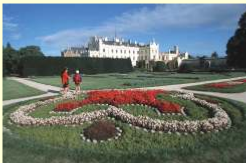
Lednice - Park und Schloss Lednice (Eisgrub)

Wichtig: gültiger Reisepass, Radler aus Ländern mit Visapflicht können diese Grenzübergänge nicht nützen (nur Drasenhöfen) (z.B. GUS Staaten)