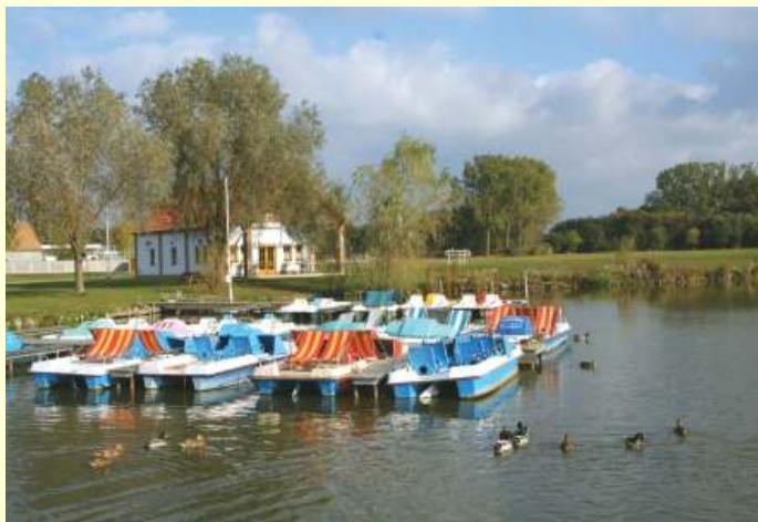
Bernhardsthal - Bootsfahrt am Teich