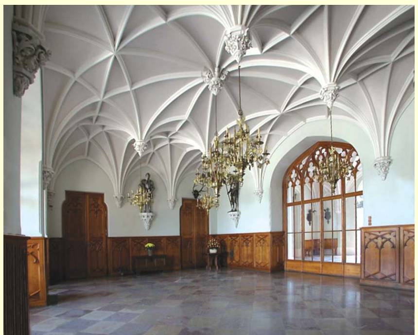
Lednice - Schloss Lednice (Eisgrub)

Sie fahren die Radtour bis Valtice Zentrum. Dort folgen Sie der Liechtensteinradroute in das Parkareal. Vorbei am Rendezvous, weiter zur Hubertuskapelle vorbei am Drei Grazien Tempel bis zur Hauptstrasse 422, überqueren, und der Zufahrtsstraße nach Hlohovec folgen, dann rechts dem See entlang zum Grenzschlösschen, den See umrunden, bis Sie wieder auf die 422 Strasse stossen, wieder queren, zum Teichschloss, geradeaus weiter bis zur Bahnlinie, links nach Lednice, in Lednice die Breclaverstrasse nach links ins Zentrum zum Schloss Eisgrub. Von dort führt Sie die Liechtensteinroute vorbei am Januv hrad bis zu einer Abzweigung (3 km). Dort stoßen Sie auf die Radtour 41 die nach rechts zum Jagdschloß führt oder gerade aus nach Breclav. Sie folgen 2km der Liechtensteinroute, dann rechts ab bis zur Breclaverstrasse, dort rechts zum Campingplatz „Apollo“ am See. Links zum Apollotempel und weiter zum Neuhof, wieder links ca. 8 km durch das Parkareal bis Sie auf die Radroute 411 stoßen. Von dort setzen Sie die Tour wie oben fort.