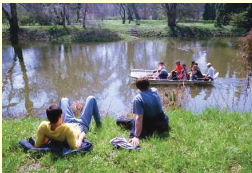
Bernhardsthal - Bootsfahrt am Teich