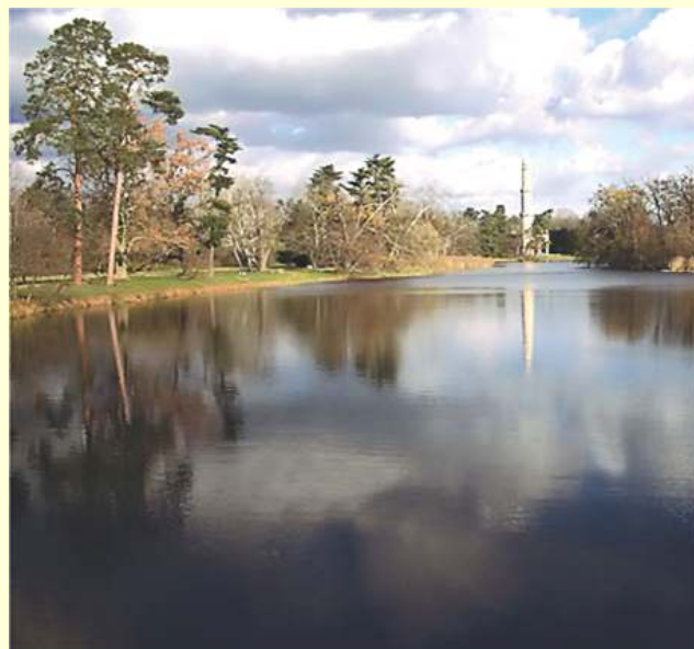
Lednice - Schlossteich mit Minarett www.breclav.info

TIC Valtice Nám. stí Svobody c. 4 Tel.: 00420/519/352 978 tic.info@radnice-valtice.cz, www.radnice-valtice.cz