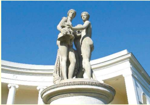
Lednice - Drei Grazien Tempel (Tri Grácie)

Tourismus Information 69144 Lednice Zámecké nám stí 68, Tel. 00420/519/340986 Tourismus Information 69142 Valtice Nám stí Svobody 4, Tel. 00420/519/352978