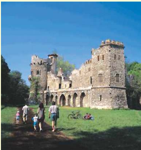
Eisgrub - künstliche Burgruine Janův Hrad

Tour: Bernhardsthal - Reintal - Katzelsdorf - Schrattenberg - Grenzübergang Valtice der Route 411 entlang - Grenzübergang Reintal - Reintal - Bernhardsthal - Gesamtlänge 33 km